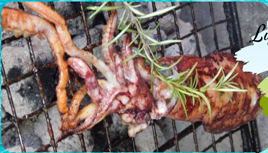
Lignje s Lastova / grill or fried Calamari from Lastovo por 400,00 kn