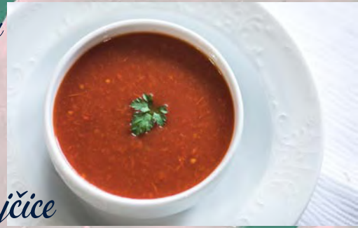
Juha od rajčice