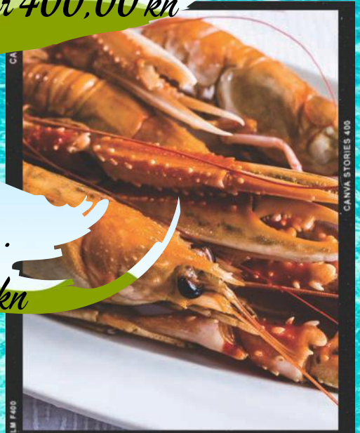
Skampi / Shrimps ..... kg 400,00 kn