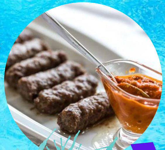
Čevapčići Mixed minced meat por 50,00 kn