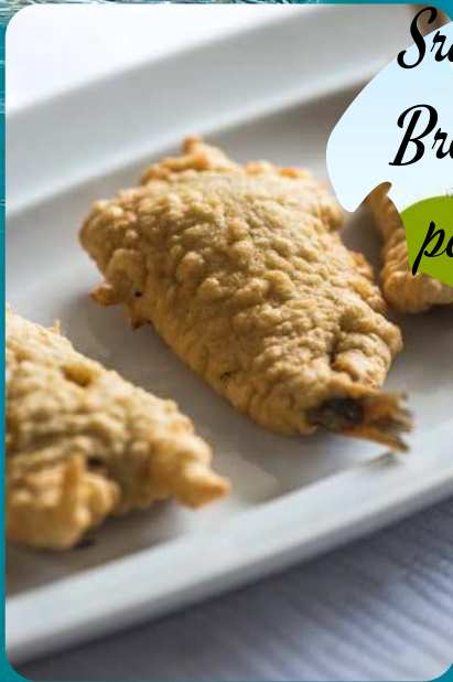
Srdele pohane / Breaded sardines por 40,00 kn