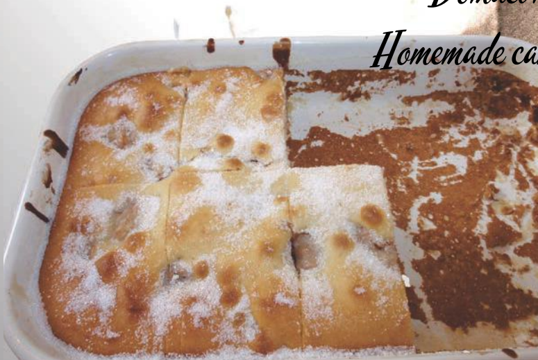
Domaći kolač / jabuka, buča, bajami, orasi Homemade cake / apple, pumpkin, almonds, walnuts por 30,00 kn