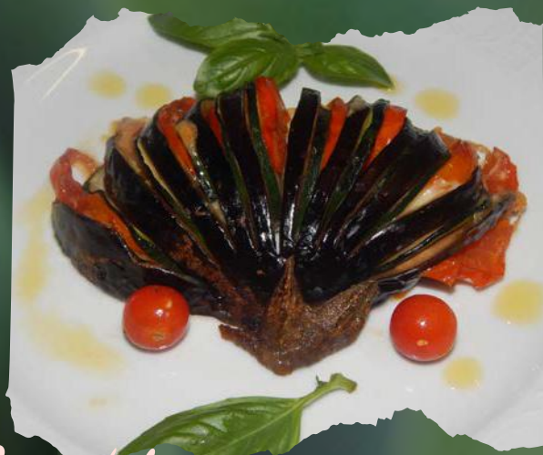
Lepeza balančana sa povrćem i sirom Eggplant with vegetables and cheese por 100,00 kn