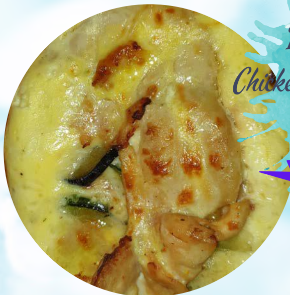
Piletina na Dolcu Chicken, cheese and vegetables por 70,00 kn