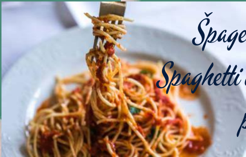
Špageti ili riža s rajčicom Spaghetti or rice with tomato sauce por 60,00 kn