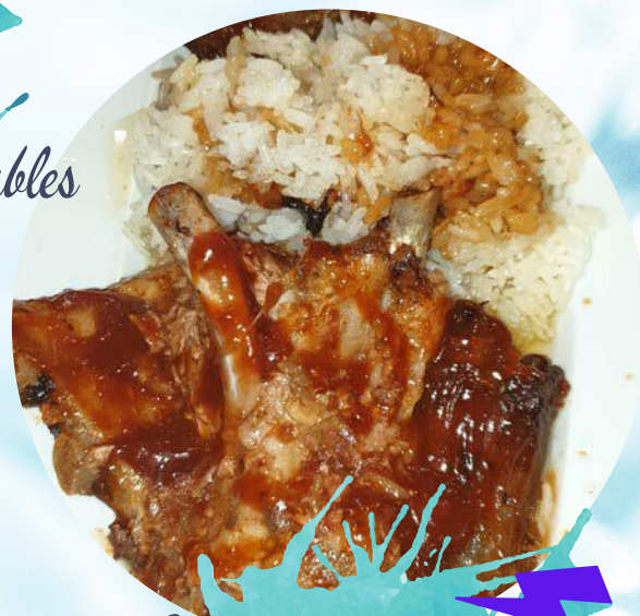
Svinjska rebra s rižom Pork ribs with rice ... por 70,00 kn