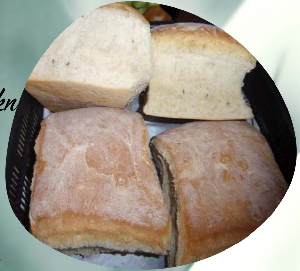
Kruh / Bread por 5,00 kn