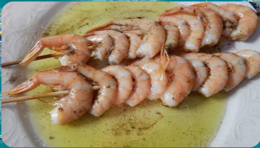
Kozice na žaru ili frigane Shrimps grilled or fried por 70,00 kn