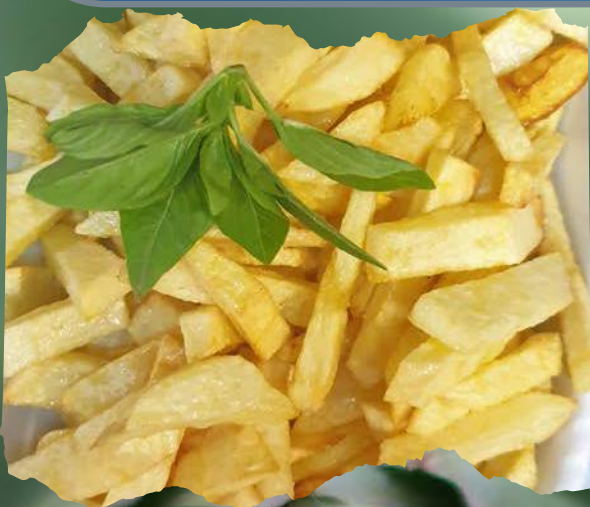
Prženi krumpir French fries por 20,00 kn