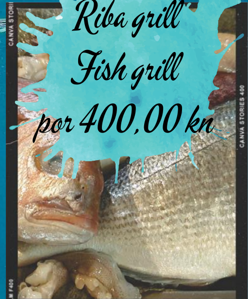
Riba grill Fish grill por 400,00 kn