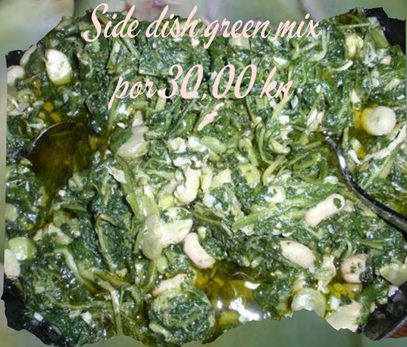
Side dish green mix por 30,00 kn