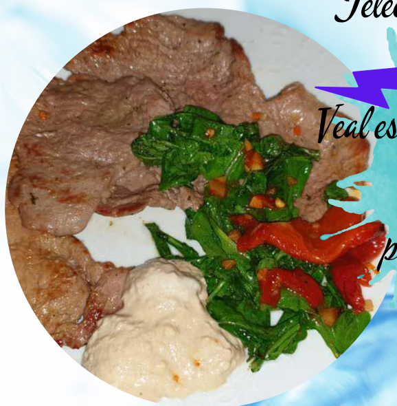
Teleći šnicel sa tunom i salata Veal escalope with tuna and salat por 120,00 kn