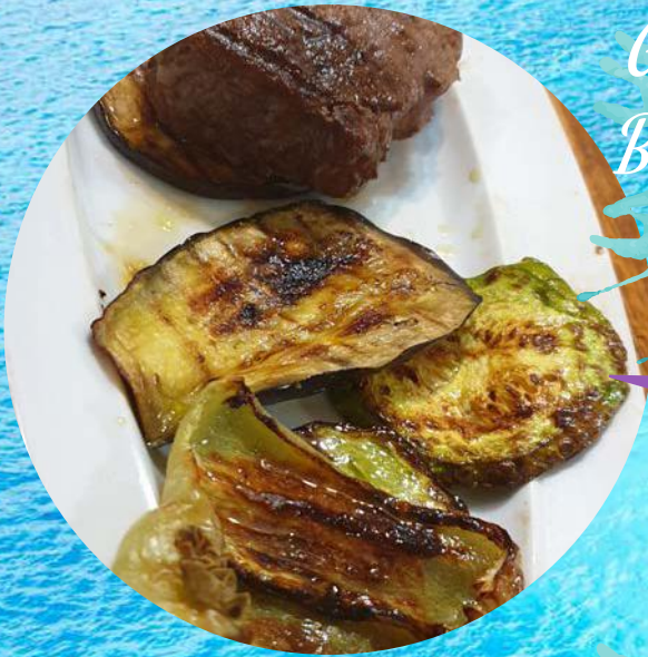
Govedi biftek s povrćem Beefsteak with vegetables por 180,00 kn