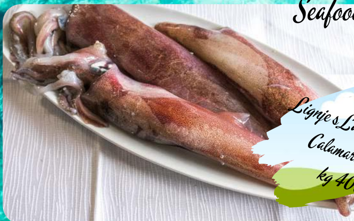
Lignje s Lastova / grill or fried Calamari from Lastovo kg 400,00 kn