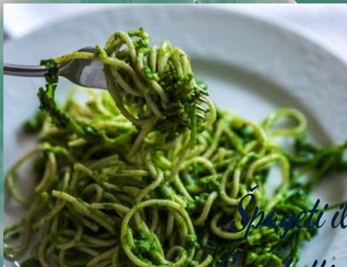
Špageti ili riža sa zelenim povrćem Spaghetti or rice with green vegetables por 60,00 kn