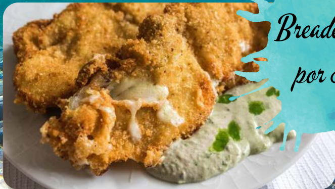
Pohovani morski pas Breaded shark fish por 80,00 kn