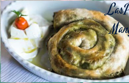
Las Parnik - blitva, zelje i sir u tijestu Mangold, greens and cheese in dough por 100,00 kn