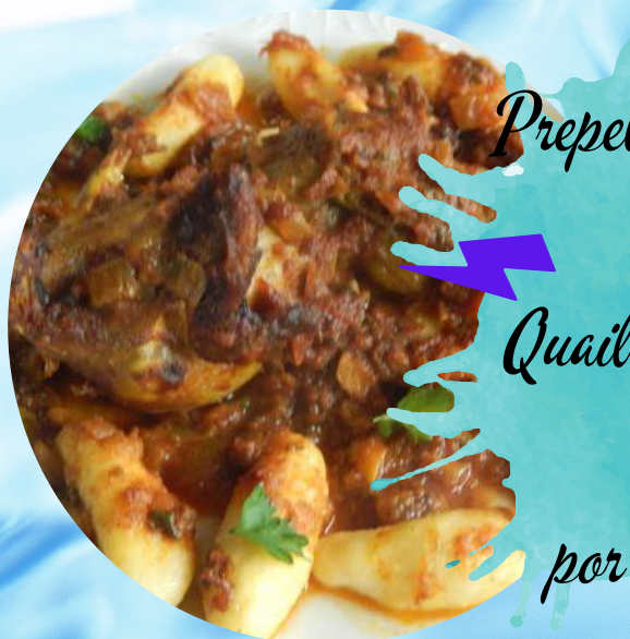
Prepelica sa njokima od buče Quail with pumpkin gnocchi por 125,00 kn