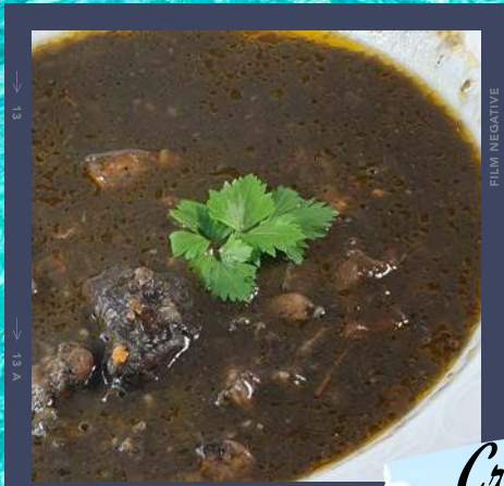
Crna juha od sipe Black cuttlefish soup por 50,00 kn