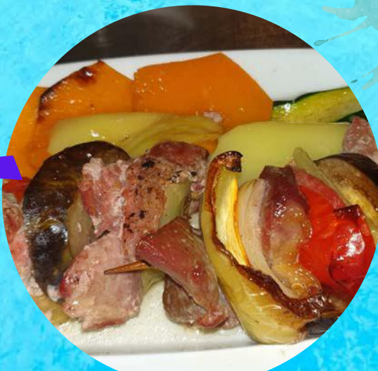
Ražnjići s mesom i povrćem Meat skewers with vegetables por 70,00 kn