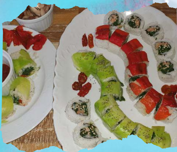
Las Sushi por 40,00 kn