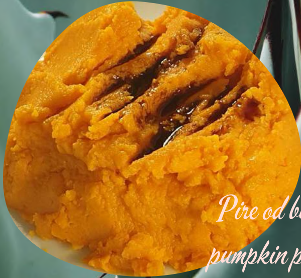
Pire od buče pumpkin puree por 35,00 kn