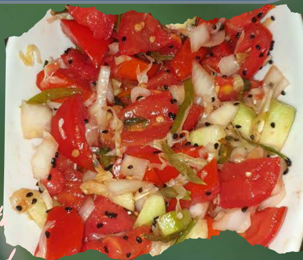
Fumar salat Fumar salad por 30,00 kn