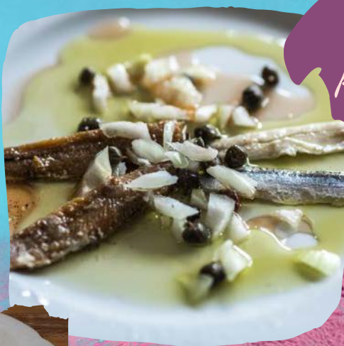
Slana sardela por 2 kom 20,00 Salted sardines