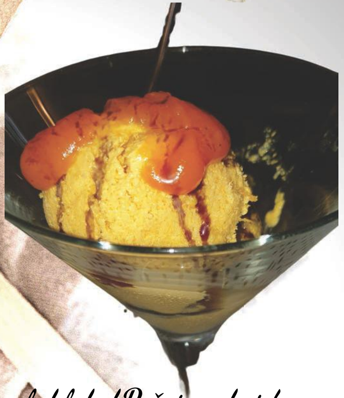
Fumar sladoled od Buče i mandarinke Fumar Icecream, pumpkin and tangerines por 50,00 kn