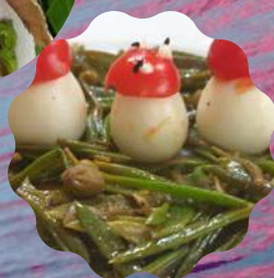
Fumar mix por 50,00